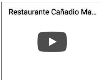
Restaurante Cañadio - Madrid-

Hogar, dulce hogar, si no te desahucian ¿Tienes algo que celebrar? Pinchos Variados Que la justicia es cara, pues sí Este fin de semana termina el Festival de Invierno de Torrelavega Bruselas es cómplice de Puigdemont El musical 'Dirty Dancing', que recrea fielmente la película, llega este mes de marzo al Palacio de Festivales